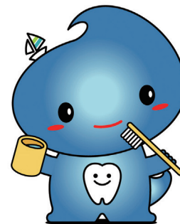
横須賀市の スカリン