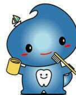
横須賀市の スカルリン